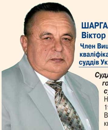
ШАРГАЛО Віктор Іванович Член Вищої кваліфікаційної комісії суддів України

Суддя Вищого господарського суду України Народився 21 січня 1951 р. До складу Вищої кваліфікаційної комісії суддів України