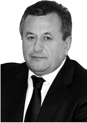
Ігор Самсін, голова Вищої кваліфікаційної комісії суддів України, кандидат юридичних наук