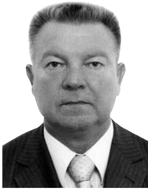
Микола Мельник, кандидат юридичних наук, заслужений юрист України, член Вищої кваліфікаційної комісії суддів України