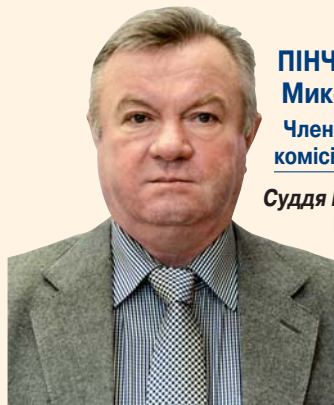
ПІНЧУК Микола Григорович Член Вищої кваліфікаційної комісії суддів України

призначений 16 вересня 2010 року рішенням X позачергового з'їзду суддів України.