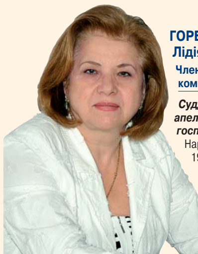
ГОРБАЧОВА Лідія Павлівна

Народилася 12 липня 1946 р. Призначена на посаду члена Вищої кваліфікаційної комісії суддів України 16 вересня 2010 року на X позачерговому з'їзді суддів. Заслужений юрист України.