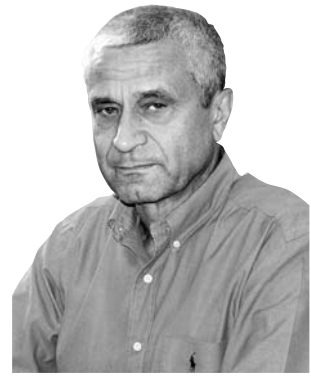
Богдан Оленчин, керівник секретаріату Вищої кваліфікаційної комісії суддів України