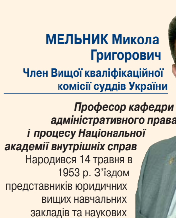
МЕЛЬНИК Микола Григорович Член Вищої кваліфікаційної комісії суддів України

України. Нагороджений орденом «За заслуги» III ступеня, нагрудним знаком Міністерства юстиції України «За заслуги», нагрудним знаком Київського міського голови «Знак пошани».