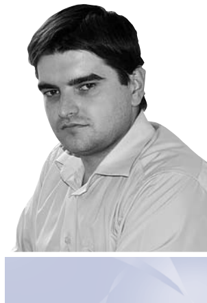
Олег Цимбалюк, начальник управління кадрової роботи Вищої кваліфікаційної комісії суддів України